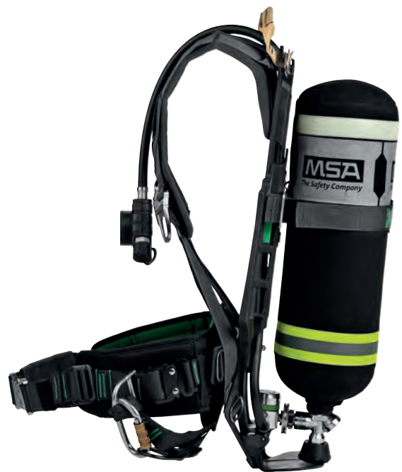
alphaBELT Pro montiert an AirMaXX Pressluftatmer