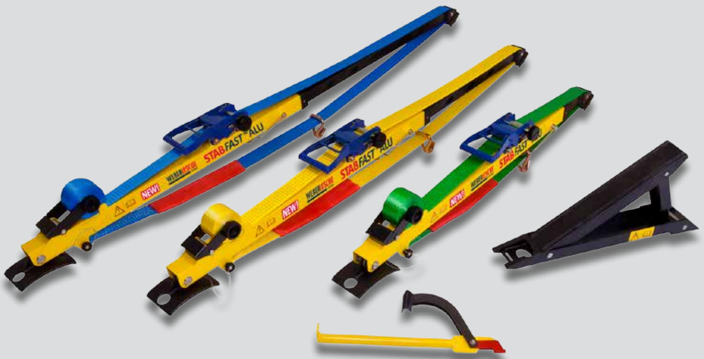
Set STAB FAST ALU