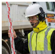
Kopf-, Augen-, Gesichts- und Gehörschutz