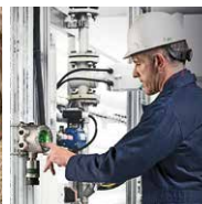
Stationäre Flammen- und Gasedektion