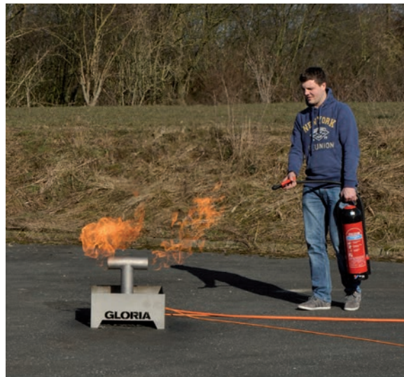
Löschangriff am Rohrbruch

Das Basismodul des FTR50 besteht aus dem Grundgerät, der Flächenbrand-Attrappe, zwei Kabeln für die Strom- und Gaszufuhr, einer Fernbedienung mit 10 m langem Kabel und zwei Taschen für den handlichen Transport dieser Utensilien. Ein Tragegriff und zwei Ausbuchtungen am Gerät ermöglichen den einfachen Transport, Handling und auch ggf. Entleerung der Wanne.