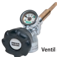
Ventil mit Manometer