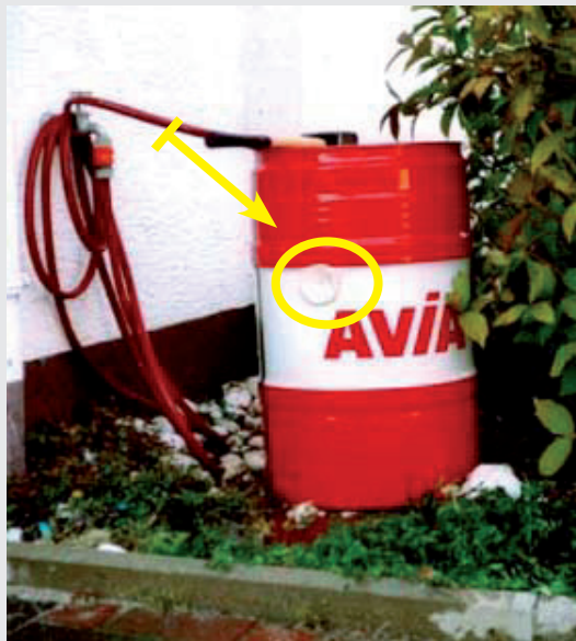
Anbringen der Abdichtpaste

Die Beständigkeitsliste für den Leckmaster ist vorhanden!