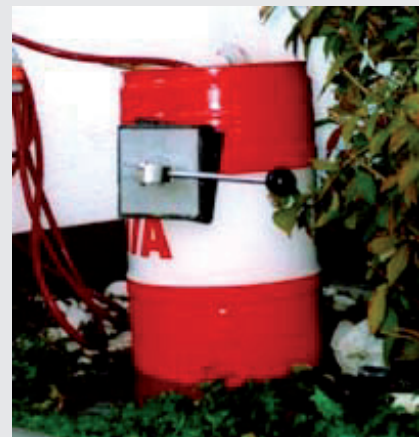
Anbringen des Leckmasters