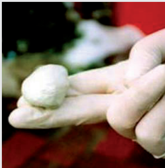
Fertig gestellte Abdichtpaste