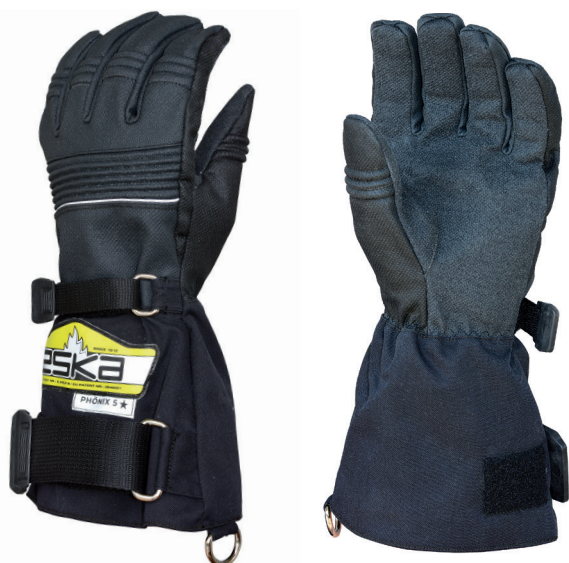
Phönix 5 ★ 8051/A

Phönix 5 ★ - neu mit Höchstwerten im Abrieb 4 und Schnitt 5 nach EN 388 zeichnet sich zudem durch seine hohe Taktilität und bestes Trageverhalten aus. Um eine ausgezeichnete Hitzebeständigkeit zu gewährleisten wird „Phönix 5 ★“ von den Fingerspitzen bis Schaftanfang 100% aus Silikon-Carbon beschichteten Kevlar® gefertigt. Die Stretchabsorber mit Luftpolestereinschlüsse im gesamten Knöchelbereich der Oberhand schützen zusätzlich vor Schlag, Stoß und großer Hitze. Das von den Fingerspitzen bis zu den Schaftenden nach ESKA® Patent eingearbeitete GORE-TEX® X-TRAFIT™ Insert ist unlösbar mit der Hülle des Handschuhs fixiert und macht den „Phönix 5 ★“ wind-, wasserdicht und atmungsaktiv. Das neu entwickelte Schnittschutzfutter aus Kevlar® mit Stahl-Fiberglas und Silberfäden verleiht diesem Qualitätshandschuh zudem eine antistatische, antibakterielle und temperaturregulierende Wirkung. Das 2-Gurtsystem garantiert sicheren Halt des Handschuhs und ein rasches An- und Ausziehen. „Phönix 5 ★“ ist anatomisch perfekt der Hand angepasst zugeschnitten und ebenso technisch verarbeitet. Der Handschuh ist mit langer Aramid-Stulpe und in kurzer Version mit einem 100% Kevlar Strickbund erhältlich.